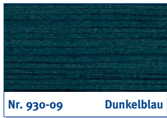
Nr. 930-09 Dunkelblau

ochre brown | brun ocre | okerbruin | ocra marrone | marrón ocre | καφέ ώχρας