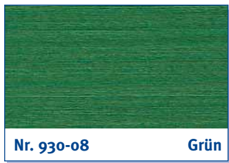
Nr. 930-08 Grün

ultramarine blue | bleu d' outremer | ultramarijnblauw | blu ultramarino | azul ultramarino | μπλε ultramarin