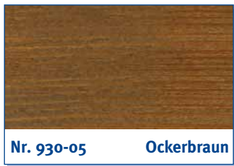
Nr. 930-05 Ockerbraun

light brown | brun clair | lichtbruin | marrone chiaro | marrón claro | καφέ ανοιχτό