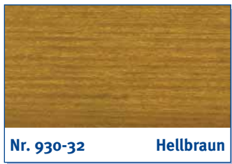
Nr. 930-32 Hellbraun

light brown | brun clair | lichtbruin | marrone chiaro | marrón claro | καφέ ανοιχτό