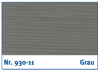
Nr. 930-11 Grau

green | vert | groen | verde | verde | πράσινο