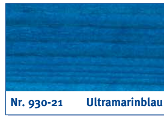
Nr. 930-21 Ultramarinblau

dark blue | bleu foncé | donkerblauw | blu scuro | azul oscuro | μπλε σκούρο