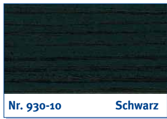
Nr. 930-10 Schwarz

grey | gris | grijs | grigio | gris | γκρι